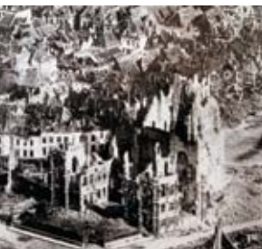
■ Hôtel de Ville en ruines ■ The ruins of the Town Hall

Pénétrez dans un des lieux les plus secrets de l'histoire militaire, à la découverte d'une véritable ville souterraine, où plus de 20 000 soldats du Commonwealth préparèrent la plus grande attaque surprise de la Première Guerre mondiale.